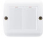
IMAGEN NO DISPONIBLE