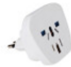
IMAGEN NO DISPONIBLE