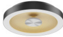
IMAGEN NO DISPONIBLE